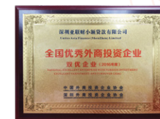
「全國優秀外商投資企業 - 雙優企業」 2016