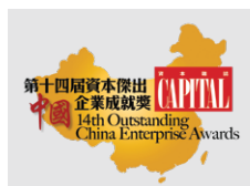
「資本中國傑出小額信貸公司」 2009 - 2019