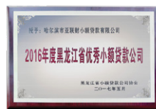
「黑龍江省優秀小額貸款公司」 2016