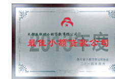
「最佳小額貸款公司」(成都亞聯財) 2014