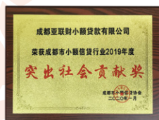
「突出社會貢獻獎」(成都亞聯財) 2019