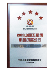
「中國五星小貸公司」(雲南亞聯財) 2013