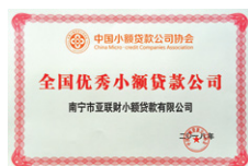
「全國優秀小額貸款公司」(南寧亞聯財) 2018