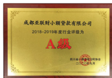
「A級小貸公司」(成都亞聯財) 2018 - 2019