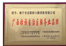
「廣西壯族自治區服務業品牌」(南寧亞聯財) 2018