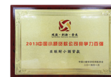
「中國小額貸款公司競爭力百強」 2012 - 2013